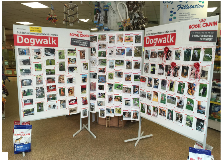
Benni Bernese Sennenhund